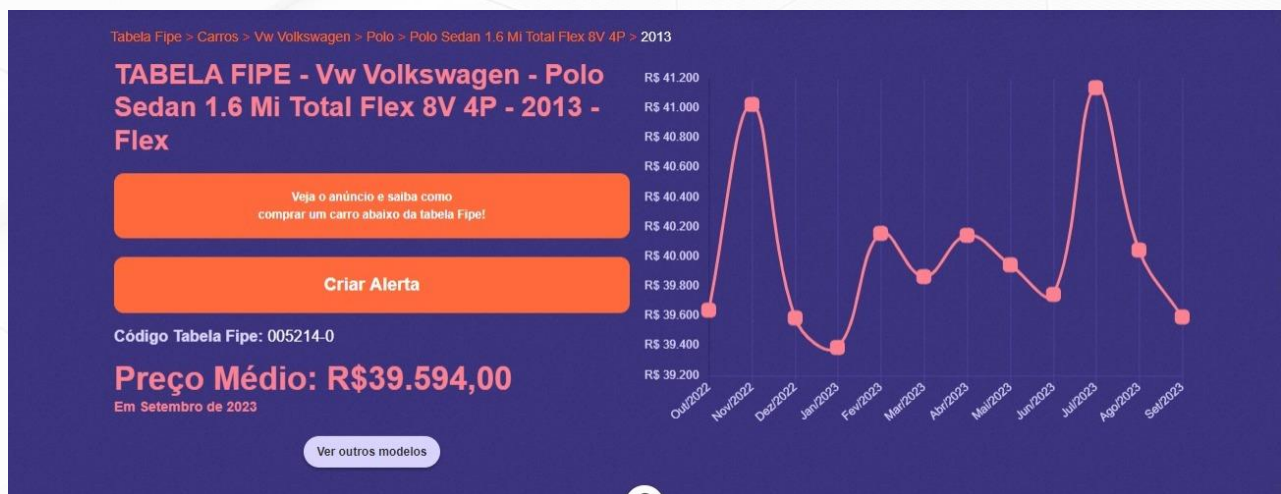
Tabela FIPE Vw Volkswagen Polo 2013 | Setembro 2023 (tabelafipecarros.com.br)