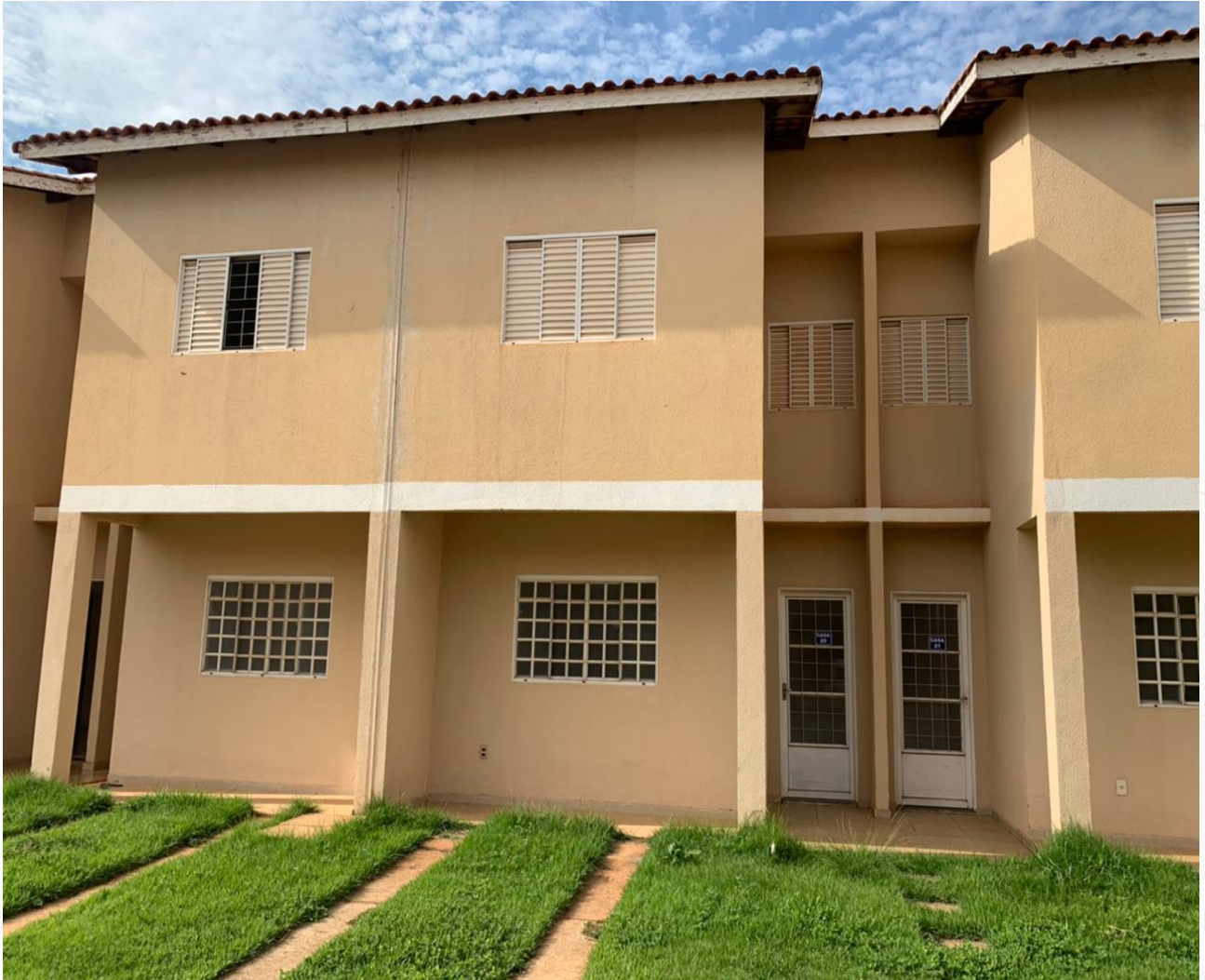
FRENTE DA CASA

Fotos tiradas na data de 30/04/2021. CONDOMÍNIO OURO NOVO