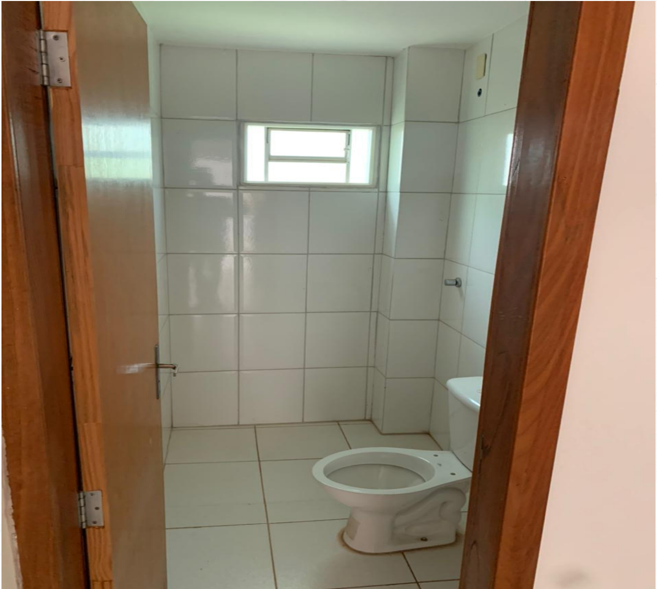
BANHEIRO PAVIMENTO SUPERIOR

Fotos tiradas na data de 30/04/2021. CONDOMÍNIO OURO NOVO